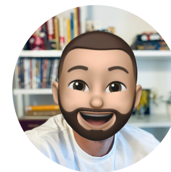
FM Visual Designer brand Designer