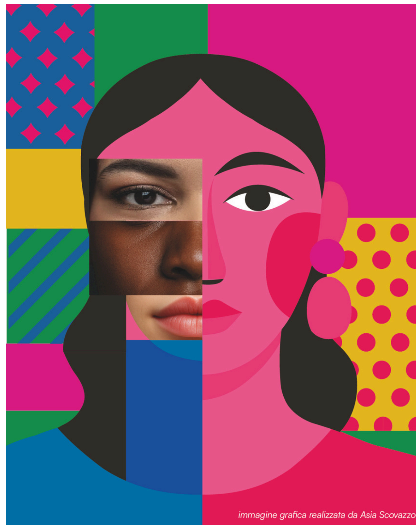
immagine grafica realizzata da Asia Scovazzo