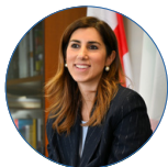
Alessia Cappello - Assessora allo Sviluppo Economico e alle Politiche del Lavoro del Comune di Milano