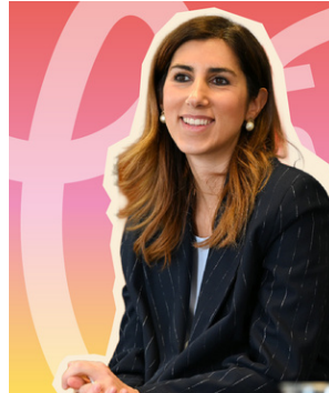
Alessia Cappello Assessora allo Sviluppo Economico e alle Politiche del Lavoro del Comune di Milano