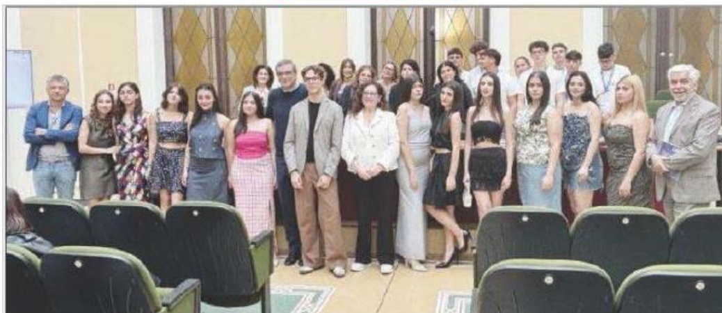
La proprietà intellettuale è riconducibile alla fonte specificata in testa alla pagina. Il ritaglio stampa è da intendersi per uso privato